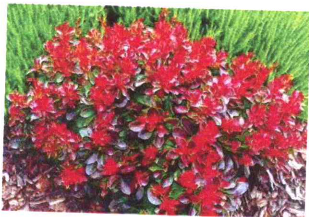
Berberis thunbergii 'Bagatelle'

Dorasta do 3 m wysokości i szerokości. Liście sezonowe, 3-5 klapowe, żółte, zielone (gatunek) lub purpurowo czerwone – inne odmiany. Kwiaty białe lub różowe zebrane w baldachy, pojawiają się w VI-VII, Owoce pęcherzykowate, czerwone. Niewymagająca roślina, rosnąca na różnych stanowiskach