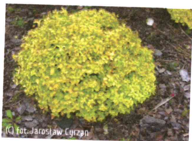
Spiraea japonica 'Golden Carpet'

Krzew, wyrasta do 2 m wys. Przyrasta ok. 20 cm rocznie. Kwiaty żółte, z zewnątrz zaczerwienione. Kwitnie na przełomie maja i czerwca. Owoce czerwone, eliptyczne, długo wiszą na pędach po opadnięciu liści. Liście purpurowo-czerwone, jesienią jaskrawe.