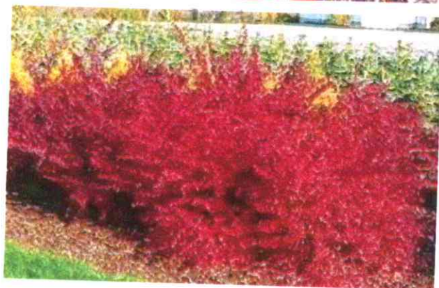
Berberis thunbergii 'Atropurpurea'

Krzew, wyrasta do 2 m wys. Przyrasta ok. 20 cm rocznie. Kwiaty żółte, z zewnątrz zaczerwienione. Kwitnie na przełomie maja i czerwca. Owoce czerwone, eliptyczne, długo wiszą na pędach po opadnięciu liści. Liście purpurowo-czerwone, jesienią jaskrawe.